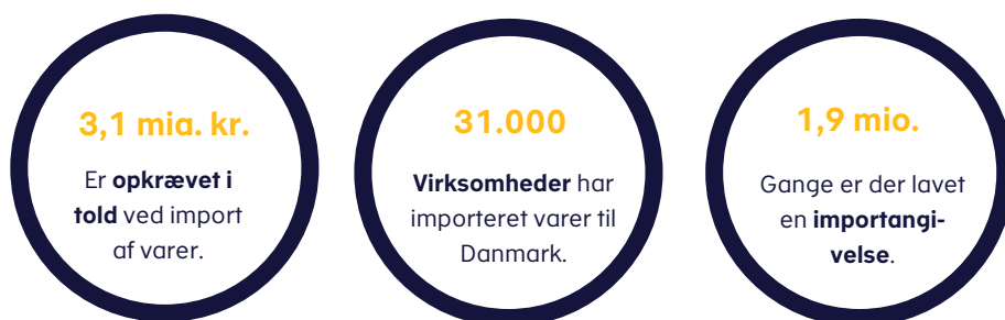
Figur 1. Nøgletal for opkrævningen af told i 2020